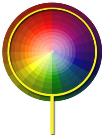
Gamma di colori prodotti dal giclée